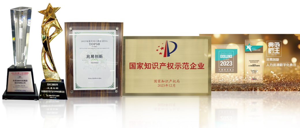
2023年度中国IC设计成就奖 “十大中国IC设计公司”